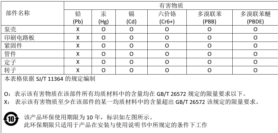
产品中有害物质的名称及含量